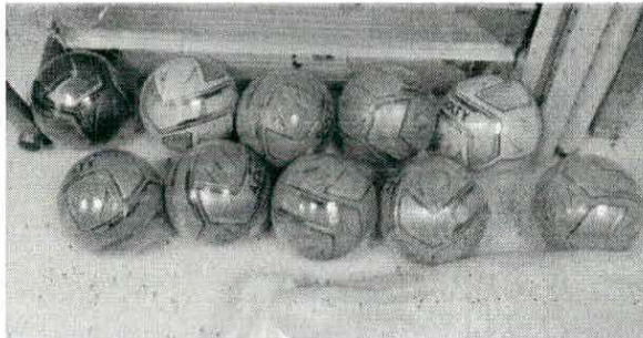
Balones de futbol No 5