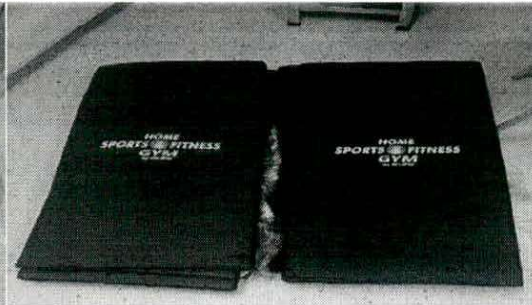
Colchonetas para ejercicios

Para constancia, se firma la presente acta: 16 AGO 2024