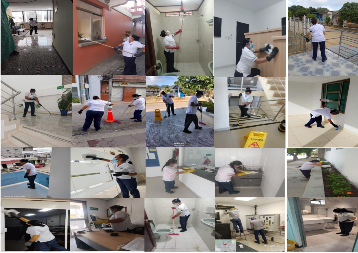
anexo evidencia fotograficas brigadas de aseo