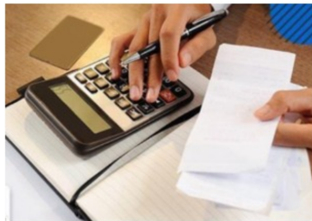
IAD de Servicios Postales de Pago