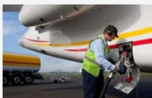
Acuerdo Marco para el Suministro de