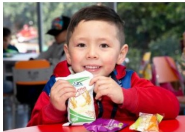
IAD para el suministro de alimentos para la operación del PAE por parte de Secretaría de Educación del Distrito III