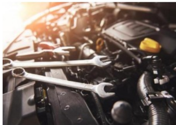
Adquisición de (i) Servicio de Mantenimiento Preventivo y Correctivo incluidas Autopartes y Mano de Obra; y (ii) Adquisición de autopartes