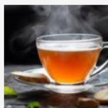
Catálogo de Panela, arc