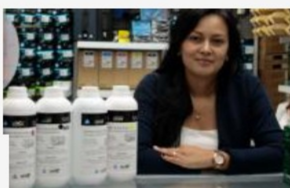
Instrumento de Agregación de Demanda