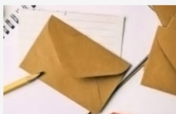
Instrumento de Agregación de demanda