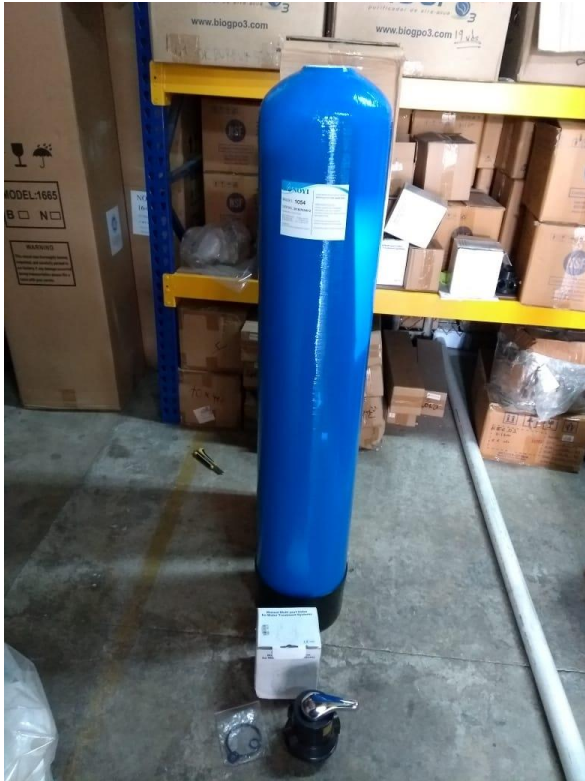
Ilustración 1 Filtro

El Importador Manifiesta que no tiene disponibilidad y que llegan varias referencias el 10 de junio, de las cuales 40 unidades son para este proceso y las siguientes llegarían 15 días después de los primeros.