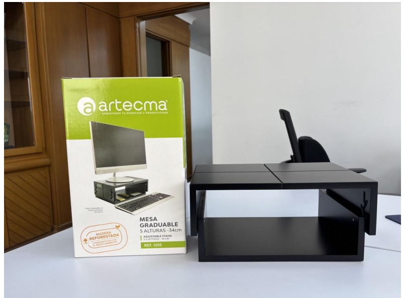
Soporte para monitor