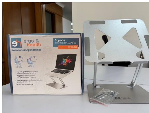
Soporte para Portátil