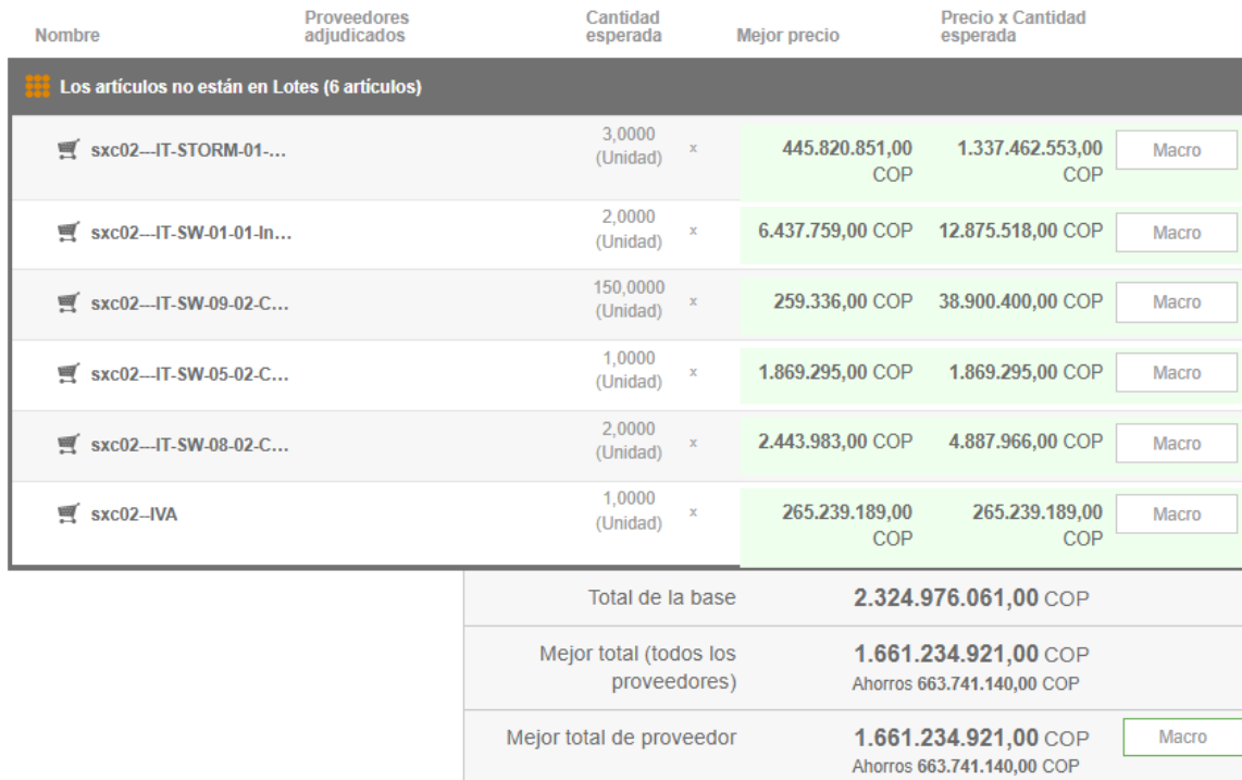
Tabla No. 1 Presentación de Oferta.