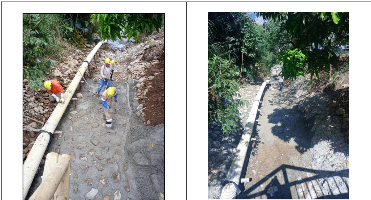
Ilustración 2. Mantenimiento quebrada Minitas. CR 83 97-59