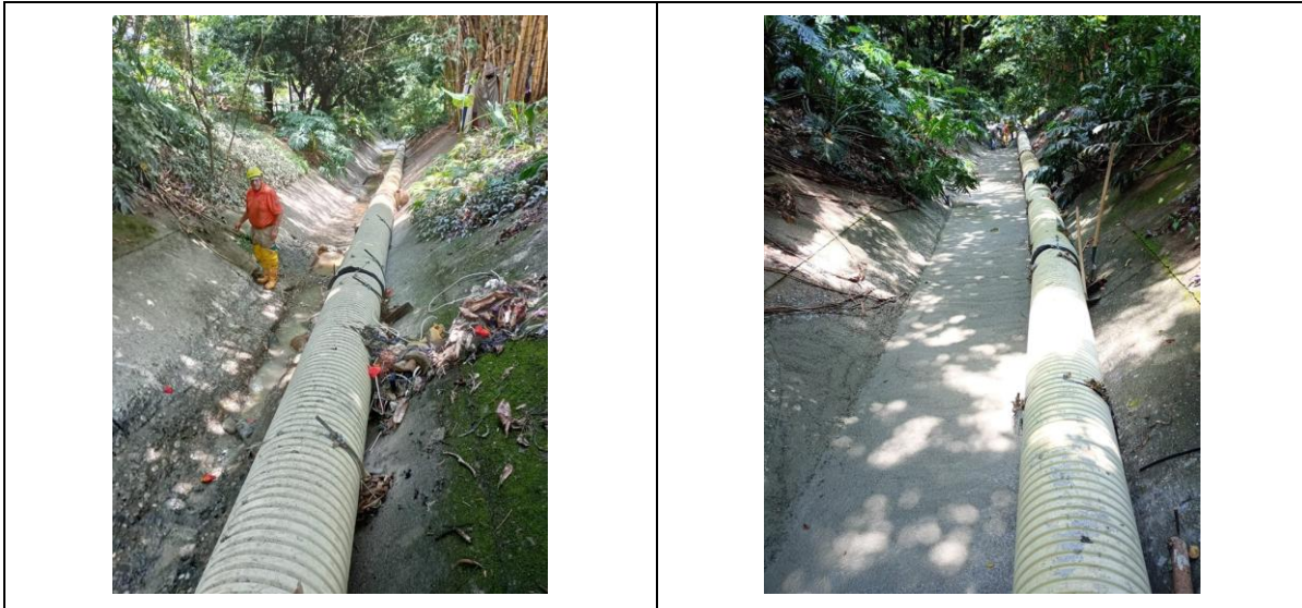
Ilustración 3. Mantenimiento quebrada Ana Díaz. CR 83 97-59