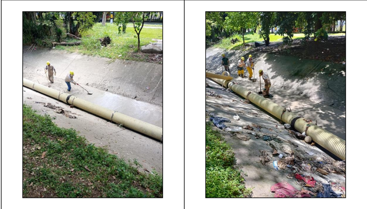
Ilustración 1. Mantenimiento quebrada Altavista, 27, 28 y 29 de septiembre del 2025.

En las imágenes muestran las labores de mantenimiento ejecutadas las quebradas Altavista, Ana Díaz y Minitas.