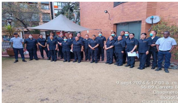
Talento humano Primer turno.