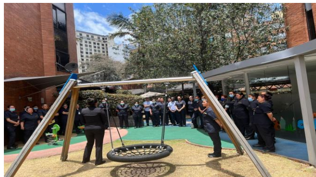
Talento humano segundo turno.