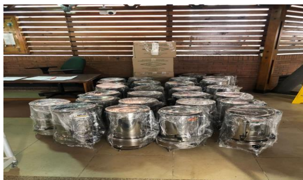
Entrega de equipamiento