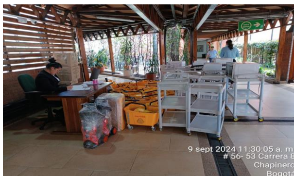
Entrega de equipamiento