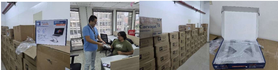
SOPORTE ALUMINIO PREMIUM PLEGABLE PARA PORTÁTIL