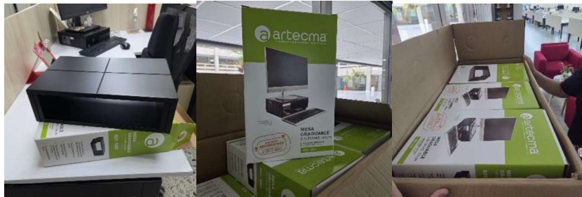
SOPORTE PARA MONITOR ESTANDAR MADERA 5 ALTURAS