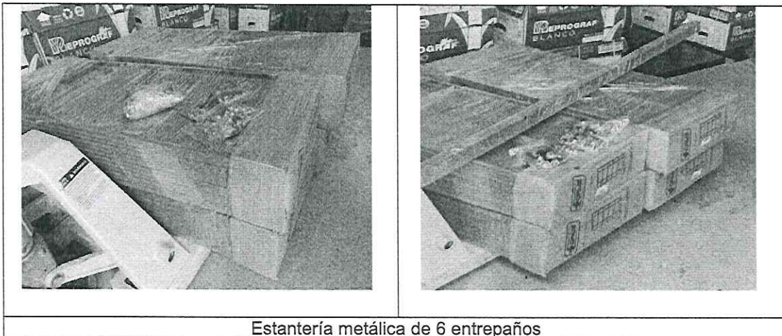
Estantería metálica de 6 entrepaños