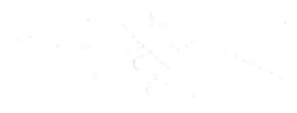
Figure 10.1: The Balance Sheet

The balance sheet is also used to calculate various financial ratios, such as the debt-to-equity ratio and the current ratio, which provide further insights into the company's financial performance.