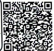
¡Escanee y pague!

Este documento es una representación grafica de la factura electronica de acuerdo con el decreto 2242 de 2015 y esta firmada por la compañía DISTRIBUIDORA NISSAN S.A. haciendo uso de un certificado digital Proveedor Tecnológico F&M Technology NIT: 900.306.823-4