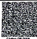
Código QR DIAN

- I.V.A. regimen comun Somos Grandes Contribuyentes Según resolución No.000200 27 de diciembre de 2024 - Somos Autorretenedores. Resolución No.0150 de 1995/09/06 - Actividad economica principal No. 4511