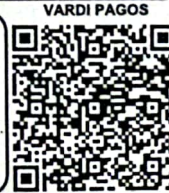
¡Escanee y pague!

Vardi Pagos Estimado Cliente, para realizar su Pago en Línea tener en cuenta las siguientes instrucciones 1. Escanear Código QR 2. Verifique el valor a cancelar 3. Seleccione la forma de pago (Tarjeta Crédito o Pago PSE - Débito de su cuenta), Nequi o Daviplata. 4. Ingresar los datos solicitados por el sistema