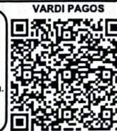
¡Escanee y pague!

Vardi Pagos Estimado Cliente, para realizar su Pago en Línea tener en cuenta las siguientes instrucciones 1. Escanear Código QR 2. Verifique el valor a cancelar 3. Seleccione la forma de pago (Tarjeta Crédito o Pago PSE - Debito de su cuenta), Nequi o Daviplata. 4. Ingresar los datos solicitados por el sistema