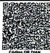
Código QR DIAN

- I.V.A. regímen común Somos Grandes Contribuyentes Según resolución No.000200 27 de diciembre de 2024 - Somos Autoretenedores. Resolución No.0150 de 1995/09/08 - Actividad económica principal No. 4511