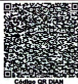
Código QR DIAN

- I.V.A. regimen comun Somos Grandes Contribuyentes Según resolución No.000200 27 de diciembre de 2024 - Somos Autoretenedores. Resolución No.0150 de 1995/09/06 - Actividad economica principal No. 4511