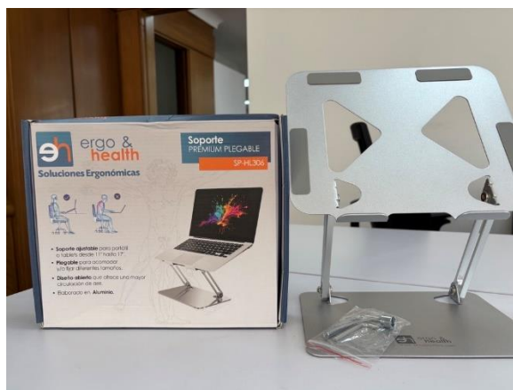
SopORTE para Portátil