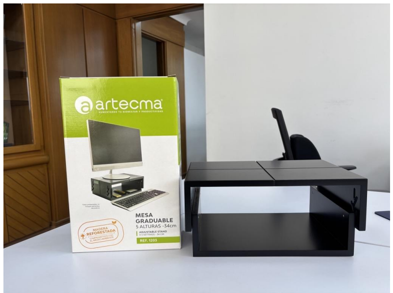
SopORTE para monitor