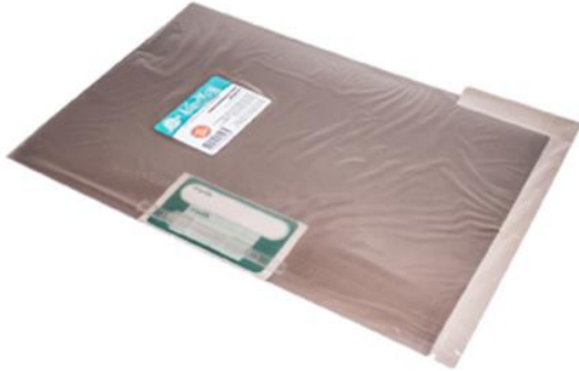
CARPETA LEGAJADORA OFICIO HUMO CON GANCHO