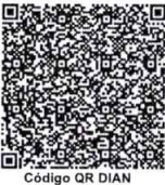
Código QR DIAN

- I.V.A. regimen comun Somos Grandes Contribuyentes Según resolución No.000200 27 de diciembre de 2024 - Somos Autoretenedores. Resolución No.0150 de 1995/09/06 - Actividad economica principal No. 4511