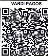
¡Escanee y pague!

Vardi Pagos Estimado Cliente, para realizar su Pago en Linea tener en cuenta las siguientes instrucciones 1. Escanear Código QR 2. Verifique el valor a cancelar 3. Seleccione la forma de pago (Tarjeta Crédito o Pago PSE - Debito de su cuenta), Nequi o Daviplata. 4. Ingresar los datos solicitados por el sistema