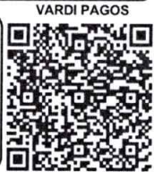
¡Escanee y pague!

Vardi Pagos Estimado Cliente, para realizar su Pago en Línea tener en cuenta las siguientes instrucciones 1. Escanear Código QR 2. Verifique el valor a cancelar 3. Seleccione la forma de pago (Tarjeta Crédito o Pago PSE - Debito de su cuenta), Nequi o Daviplata. 4. Ingresar los datos solicitados por el sistema