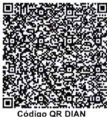
Código QR DIAN

- I.V.A. regimen comun Somos Grandes Contribuyentes Según resolución No.000200 27 de diciembre de 2024 - Somos Autoretenedores. Resolución No.0150 de 1995/09/06 - Actividad economica principal No. 4511