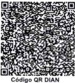
Código QR DIAN

- I.V.A. regimen comun Somos Grandes Contribuyentes Según resolución No.000200 27 de diciembre de 2024 - Somos Autoretenedores. Resolución No.0150 de 1995/09/06 - Actividad economica principal No. 4511