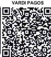
¡Escanee y pague!

Vardi Pagos Estimado Cliente, para realizar su Pago en Linea tener en cuenta las siguientes instrucciones 1. Escanear Código QR 2. Verifique el valor a cancelar 3. Seleccione la forma de pago (Tarjeta Crédito o Pago PSE - Debito de su cuenta), Nequí o Daviplata. 4. Ingresar los datos solicitados por el sistema