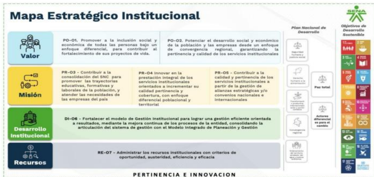
Ilustración 5 Mapa estratégico institucional

La Entidad organiza y desarrolla sus actividades bajo un enfoque de gestión por procesos y procedimientos, en coherencia con el Modelo Integrado de Planeación y Gestión (MIPG), como marco orientador de la planeación, ejecución, seguimiento y mejora de la gestión pública. Los procesos y procedimientos se encuentran debidamente documentados y administrados a través de la plataforma Compromiso, la cual consolida los instrumentos normativos y operativos necesarios para asegurar la estandarización, trazabilidad y control de la gestión institucional.