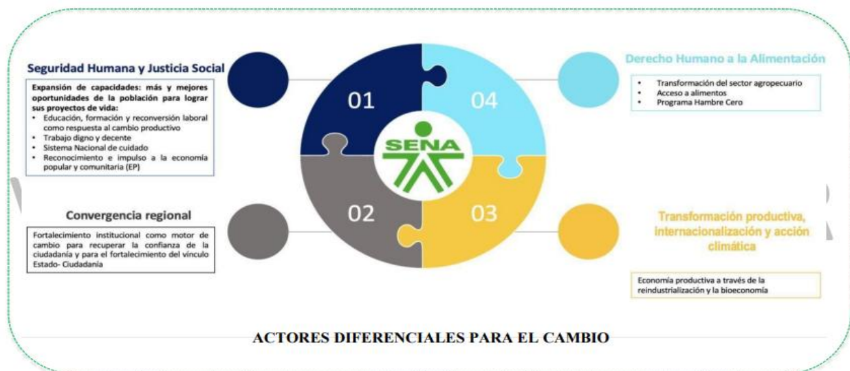
Ilustración 4 Alineación con Plan Nacional de Desarrollo 2022 – 2026

El SENA, por su misionalidad y presencia a nivel nacional, tiene relación con todas las transformaciones; sin embargo, su alineación principal está con la transformación de Seguridad Humana y Justicia Social, seguidas por las transformaciones de Seguridad Alimentaria, Transformación Productiva y la Convergencia Regional, conectadas a los actores diferenciales del cambio.