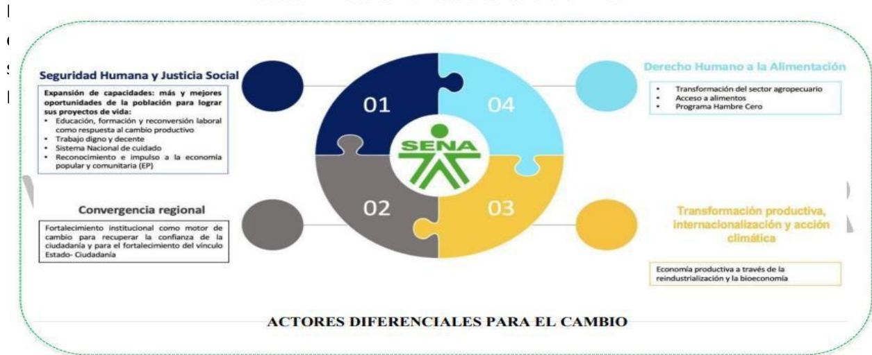
Ilustración 4 Alineación con Plan Nacional de Desarrollo 2022 – 2026

El Plan Estratégico 2023-2026 (Versión 2) define la proyección institucional hasta 2026, con visión a 2030, basándose en los principios, valores, compromisos, misión, visión, perspectivas, objetivos, iniciativas e indicadores estratégicos. El mapa estratégico resultante visualiza la estructura de la estrategia a través de objetivos orientados a la creación de valor público, definiendo las acciones, los derechos garantizados y las prioridades de la administración, en línea con las directrices del gobierno nacional.