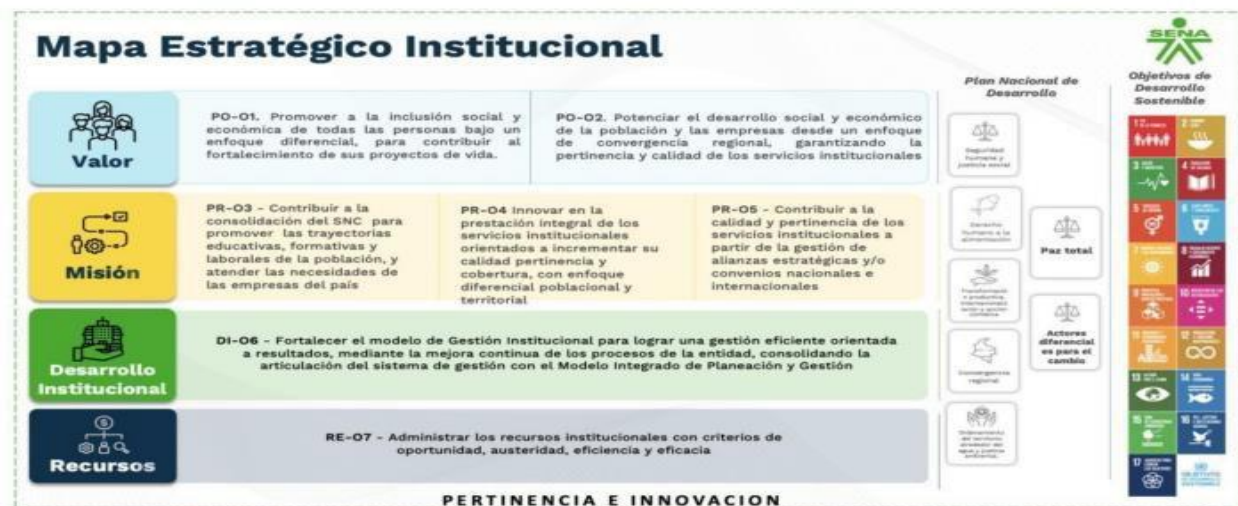
Ilustración 5 Mapa estratégico institucional

El desarrollo de una Formación Profesional Integral, conforme a la misión y visión del SENA, requiere la disposición de ambientes de aprendizaje adecuados, que incluyen espacios convencionales y especializados. El centro cuenta con una sede propia que alberga laboratorios, plantas y aulas convencionales, ofreciendo un punto de partida para las actividades formativas. Sin embargo, la capacidad actual de la infraestructura física es insuficiente para satisfacer las necesidades de la formación titulada presencial, lo que obstaculiza el logro de las metas trazadas y el pleno desarrollo de la oferta formativa.