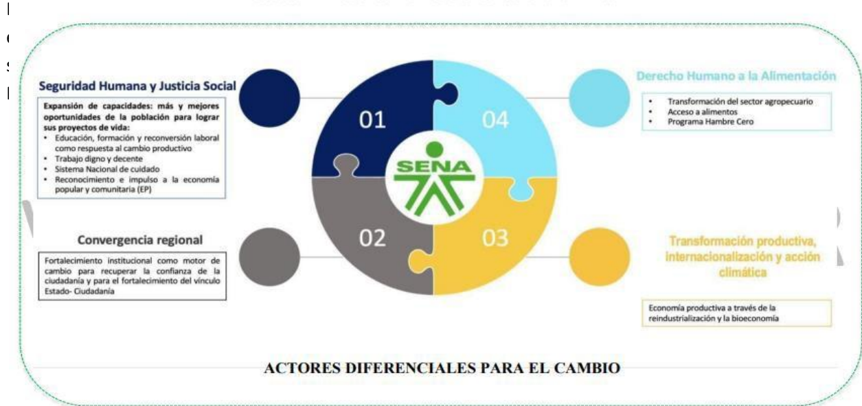
Ilustración 4 Alineación con Plan Nacional de Desarrollo 2022 – 2026

El Plan Estratégico 2023-2026 (Versión 2) define la proyección institucional hasta 2026, con visión a 2030, basándose en los principios, valores, compromisos, misión, visión, perspectivas, objetivos, iniciativas e