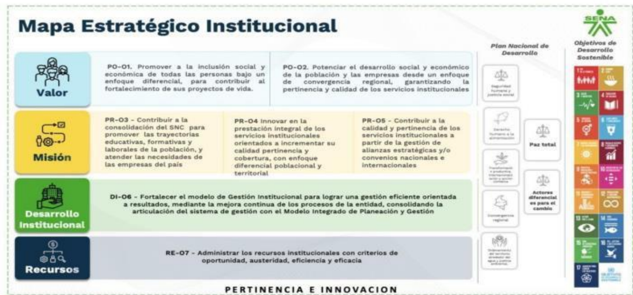
Ilustración 5 Mapa estratégico institucional

El desarrollo de una Formación Profesional Integral, conforme a la misión y visión del SENA, requiere la disposición de ambientes de aprendizaje adecuados, que incluyen espacios convencionales y especializados. El centro cuenta con una sede propia que alberga laboratorios, plantas y aulas convencionales, ofreciendo un punto de partida para las actividades formativas. Sin embargo, la capacidad actual de la infraestructura física es insuficiente para satisfacer las necesidades de la formación titulada presencial, lo que obstaculiza el logro de las metas trazadas y el pleno desarrollo de la oferta formativa.