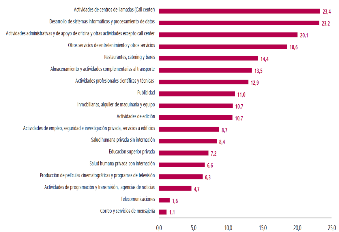
Gráfico 1. Variación anual de los ingresos nominales, según subsector de servicios Total nacional Diciembre 2022 p

Según el DANE, en Boletín Técnico – “Encuesta Mensual de Servicios Bogotá” generado en diciembre de 2022, Todos los subsectores de servicios presentaron variación positiva en los ingresos nominales, en comparación con diciembre de 2021.