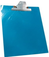
TABLA PLANILLERA OFICIO PLASTICA o Planillero plástico, tamaño oficio, color sujeto a disponibilidad de inventario. Precio por unidad

26 iaver8nco2725c0 - TABLA PLANILLERA OFICIO PLASTICA 1 $ 7.731 $ 1.469 $ 7.731 $ 9.200