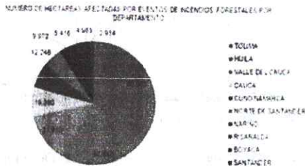
Figura 11: Número de hectáreas afectadas por eventos de incendios forestales registrados en los 10 departamentos más afectados entre el 16 de junio y el 14 de septiembre periodo 1914 - 2024. Fuente: Informe Segunda Temporada Seca 2024 - UNGRD

Finalmente, en número de hectáreas afectadas los departamentos de Tolima, Huila y Valle del Cauca con 87.805, 57.837 y 31.810 son los de mayor afectación (Ver Figura 11).