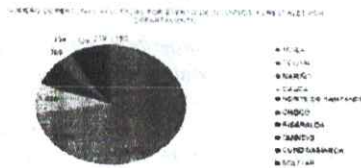
Figura 9: Número de personas afectadas por eventos de incendios forestales registrados en los 10 departamentos más afectados entre el 16 de junio y el 14 de septiembre periodo 1914 - 2024

Por número de personas afectadas los departamentos de Huila, Tolima y Nariño con 4.051, 2.318 y 2.306 son los departamentos que presentan los mayores registros (Ver Figura 9)