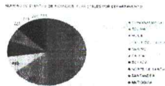
Figura B: Número de Eventos de Incendios Forestales Registrados en los 10 departamentos más afectados entre el 16 de junio y el 14 de septiembre periodo 1914 - 2024 Fuente: Informe Segunda Temporada Sesa 2024 - UNGRD

(...) los incendios forestales por departamento se presentan en la Figura B, allí se puede observar que los departamentos de Cundinamarca, Tolima y Huila son los que más eventos de incendios forestales han registrado, con 1.606, 1.355 y 928 respectivamente.