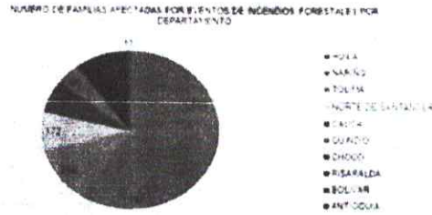
Figura 10: Número de familias afectadas por eventos de incendios forestales registrados en los 10 departamentos más afectados entre el 16 de junio y el 14 de septiembre periodo 1914 - 2024.

En número de familias afectadas los departamentos de Huila, Nariño y Tolima con 810, 457 y 248 registran los valores más altos (Ver Figura 10):