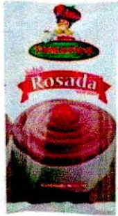
Salsa rosada x 8 gramos paquete x 100

Salsa rosada x 8 gramos paquete x 100 unidades, Marca (Tomatico) IMAGEN DE REFERENCIA - SUJETO A DISPONIBILIDAD