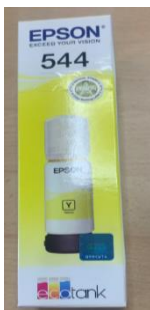
TINTA AMARILLA EPSON