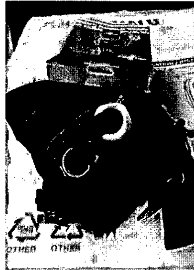
Extensores para gimnasio

Para constancia, se firma la presente acta: