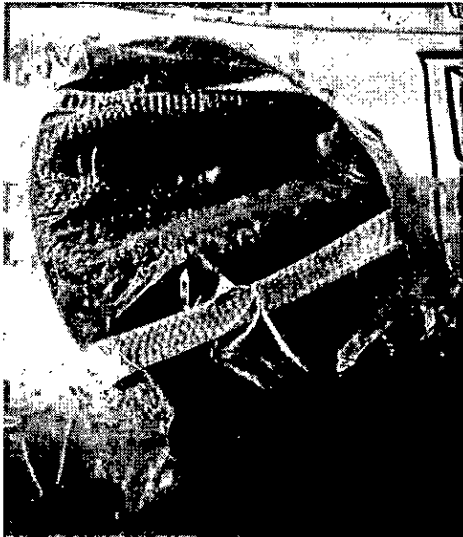
Balón de baloncesto