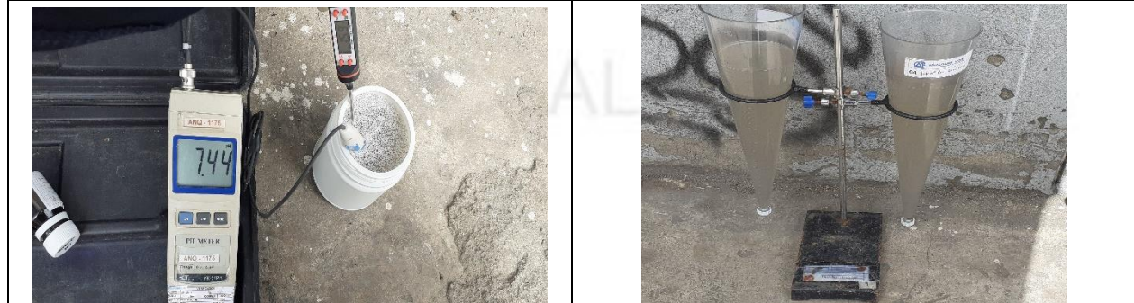
Fotografía 3. Medición In Situ