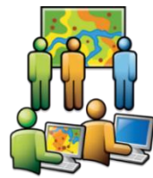
Crear y compartir