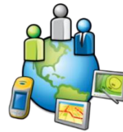
Cualquier: Usuario, lugar, dispositivo