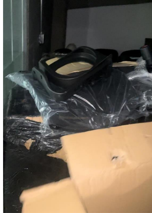
Imagen No 2