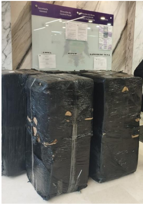
Imagen No 1