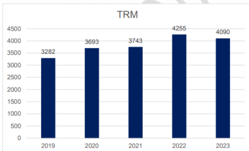
Gráfico 1. Gráfica variación TRM últimos 5 años

El comportamiento de la Tasa Representativa del Mercado (TRM) en Colombia en los últimos cinco (5) años ha tenido un impacto directo en los costos asociados a materias primas. Esto se debe a que parte de los insumos de la industria manufacturera proviene de diferentes países, lo que significa que el factor que puede afectar los precios de este sector está estrechamente relacionado con la fluctuación de la TRM.