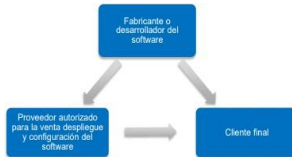
Ilustración 3 Cadena de distribución software de propósito específico

Existen casos en los cuales los clientes finales integran el software dentro de una solución de múltiples componentes de TI, casos en los cuales hacen uso de un integrador como puente entre el cliente y los diferentes proveedores de servicios de TI, en este tipo de contratación el integrador se ubica en medio del cliente final y el desarrollador o distribuidor del software dentro de las cadenas de distribución previamente descritas.