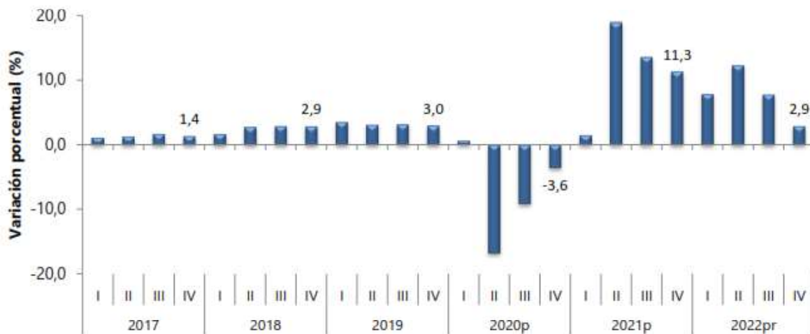
Gráfico 1. Producto Interno Bruto Tasa de crecimiento en volumen 1 2017-I / 2022 pr -IV