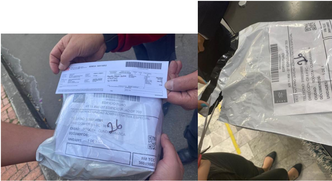
Entrega de DJI Osmo Pocket 3 Creator Combo

Se realizó la descarga de los bienes en las instalaciones de la Unidad de Proyección Normativa y Estudios de Regulación Financiera – URF, para lo cual se adjuntan a continuación las evidencias fotográficas: