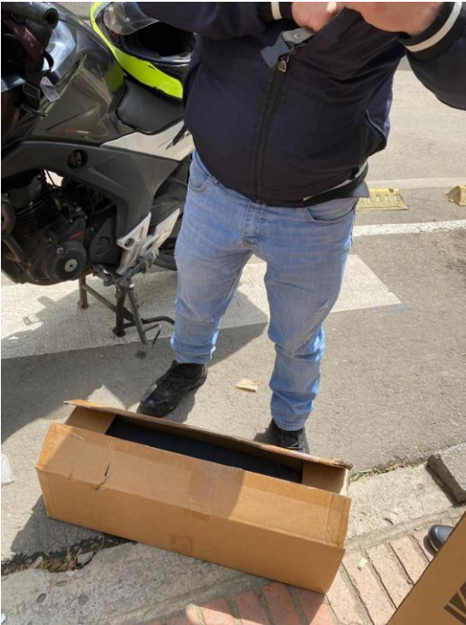
Entrega de Kit de iluminación Softbox para fotografía, trípode de cabeza fluida Weifeng, lente objetivo Canon 50 mm F 1.8 STM.