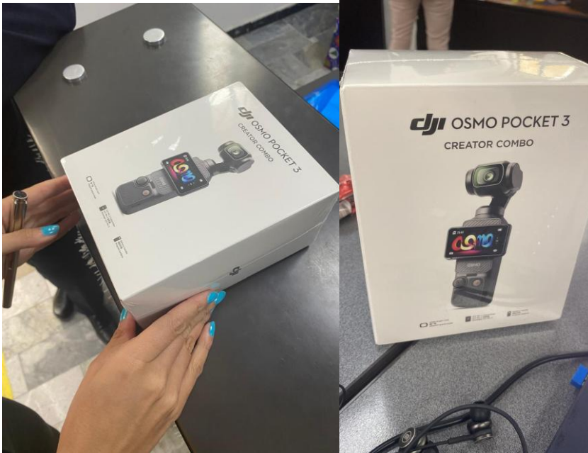
Revisión del DJI Osmo Pocket 3 Creator Combo

Se procedió a realizar pruebas y revisiones de los bienes recibidos con el propósito de verificar su correcto funcionamiento y que las cajas cuentan con la totalidad de las piezas necesarias para su montaje: