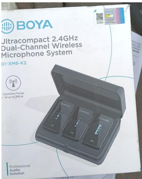
Entrega de micrófono inalámbrico de solapa Goya BY- XM6-K2