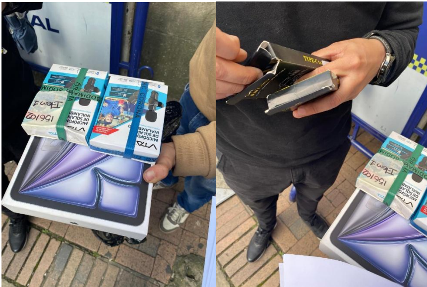
Entrega de Tablet Ipad Air 11, replicador USB (2 unidades) y micrófono de solapa VTA inalámbrico (2 Unidades).