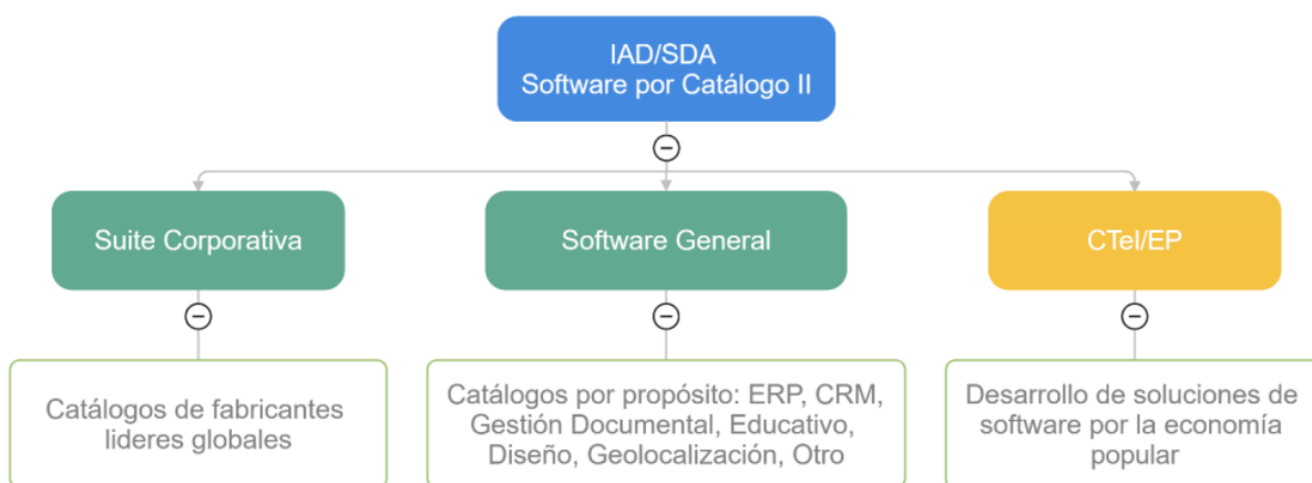
Gráfica 1 - Segmentación IAD/SDA

ADQUISICION A TRAVES DE INSTRUMENTO DE AGREGACIÓN DE DEMANDA IAD/SDA DE SOFTWARE POR CATÁLOGO II (CCE-SNG-IAD002-2024)