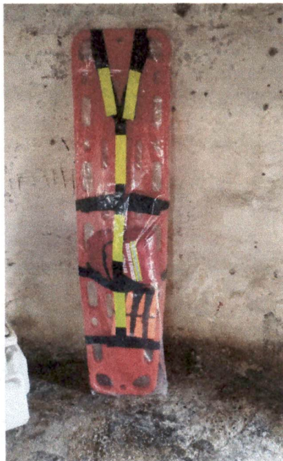
FOTOGRAFIAS KIT DE EMERGENCIA CON BOTIQUIN TIPO A