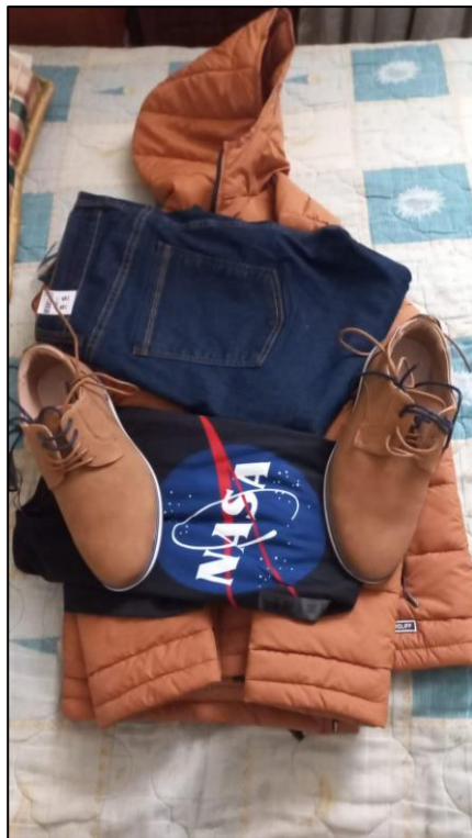
Evidencias entrega de dotación asistencial para el personal de CPE